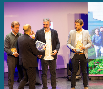
↑ Les Fermes Larrère - Trophée « Made in Landes »