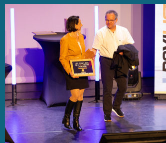
↑ Pavilift - Trophée « Développement et Investissement »