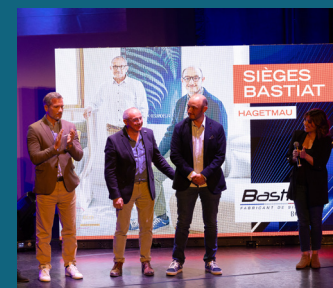
↑ Sièges Bastiat - Trophée « Coup de cœur »