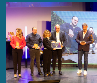
↑ UNELO - Trophée « Eco-responsable »