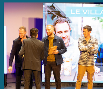
↑ Le Village de Lucas - Trophée « Le concept »