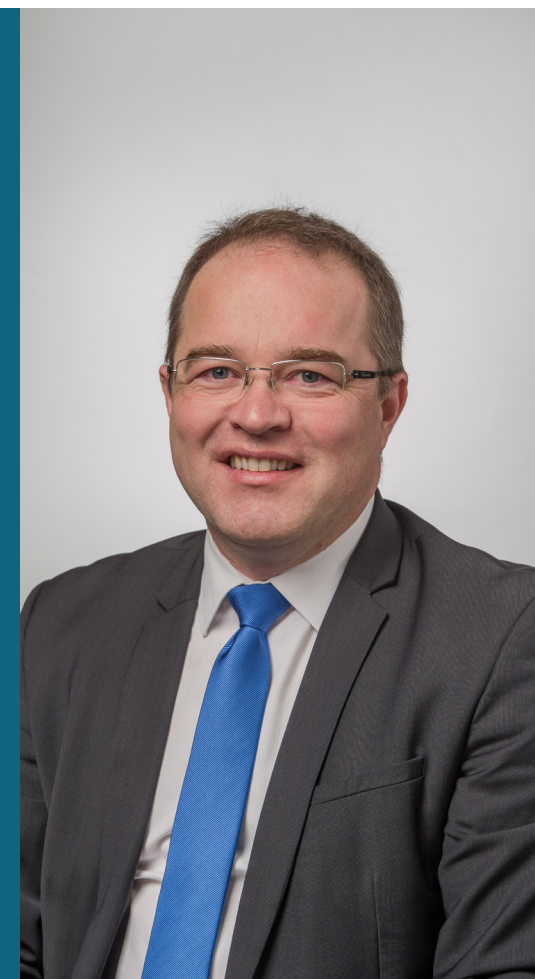
↑ Renaud LAGRAVE, Vice-Président de la Région Nouvelle-Aquitaine, chargé des Infrastructures, des Transports et des Mobilités