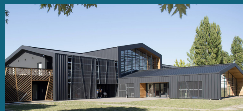
↑ Campus Landes à Mont-de-Marsan

Une convention avec Excelia Tourism School présente à La Rochelle a été signée en vue de l'ouverture d'un cursus de formation Bachelor (Bac +3 RNCP) en management dans le tourisme et l'hôtellerie à Dax. Avec le soutien du Grand Dax, la ville thermale a notamment été choisie en raison de sa cohérence géographique (reentrée septembre 2024).