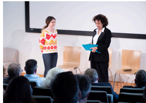
↑ La pièce de théâtre « Un employé nommé désir » pour mieux cerner les bonnes pratiques du recrutement

Soirée à thème sur le sens du travail avec la projection d'un documentaire « Why Do We Even Work » suivi d'un débat.