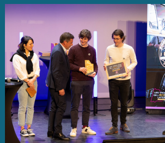
↑ L'APÉROGON bière truck - Trophée « Jeune pousse »