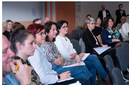
↑ Le Club RH du 9 mars 2023