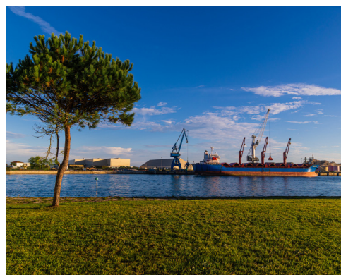
Port de Bayonne

Cette formation de 2 jours vise à améliorer les pratiques de prospection à l'export, parfaire sa maîtrise des pratiques et outils de négociations à l'international, développer des leviers de vente en optimisant son portefeuille client et trouver des pistes d'amélioration de process entre services pour fluidifier l'opérationnel export.