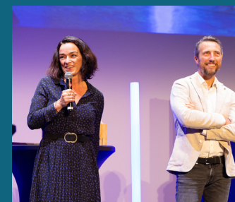
↑ La Villa de l'Étang Blanc - Trophée « Le spot »